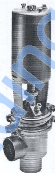
Fig. 1. ARC med ventilhuskombination 20.

Optimal produkttemperatur: 30-80°C. Temperaturområde: -10°C til +140°C (EPDM). Maks. sterilisations-temperatur (damp): 150°C ved p_{abs} = 476 kPa (4,76 bar). Luftryk: 500-700 kPa (5-7 bar).