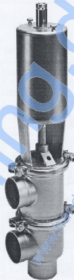
Fig. 1. SRC ventil med ventilhuskombination 21.