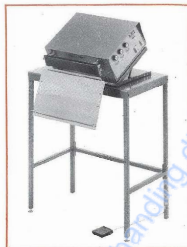
Type 14 N 030 med 45° posebakke, kipbar underplade og stativ.

Specialudførelser kan leveres med: skæretråd, afskærekniv, afriver, rullestativ.