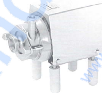
Fig. 2. GM-1A med kappe og ben.