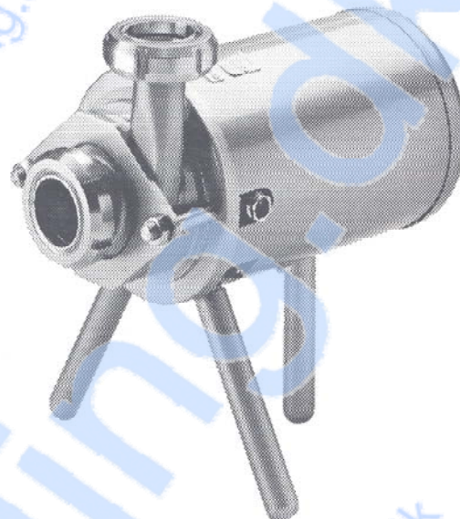
Fig. 1. FM-0 med kappe og ben.