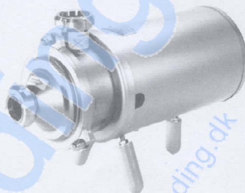
Fig. 1. MR-166B væskeringspumpe.